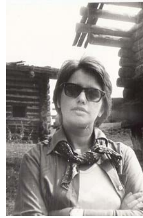
фото 1976 г.