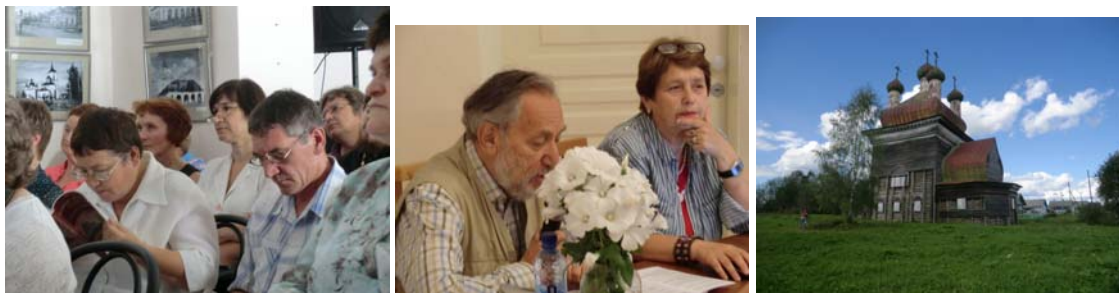
Город Каргополь (исторический и современный), Архангельская область, участники конференции во время заседаний и Храм в с. Архангело. Фото 2014

На конференции обсуждались вопросы современного изучения и сохранения историко-культурных ландшафтов с учетом активного строительства, как в городах, так и в сельской местности, особенно в структуре агломераций. Вставал вопрос о принципах сохранения материальной среды исторического города как носителя духа места. Важным было рассмотрение проблем сохранения деревянной исторической жилой застройки и одновременно нового строительства в контексте сохранения и развития архитектурно-градостроительного наследия, возможности сохранения и развития деревянных городов и разные подходы, имеющиеся в современной России. Обсуждались информационно-коммуникационные технологии как ресурс сохранения наследия, а также специфика и возможности образования в сфере реставрации памятников и нового строительства в исторических территориях. Специальным аспектом рассмотрения стал анализ разработанных охранных зон г. Каргополя, строительства башни связи высотой 72 метра в пределах охранной зоны города, а также законодательных документов и дополнений в Градостроительный кодекс РФ. Поднимались вопросы исторических и археологических материалов, анализировались опыт и методы такого типа исследований.