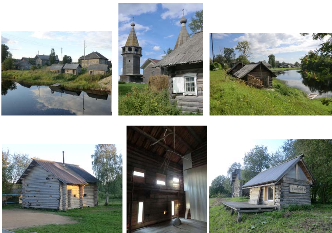
Село Ошевенское, Архангельская область. Фото 2014

На конференции обсуждались вопросы современного изучения и сохранения историко-культурных ландшафтов с учетом активного строительства, как в городах, так и в сельской местности, особенно в структуре агломераций. Вставал вопрос о принципах сохранения материальной среды исторического города как носителя духа места. Важным было рассмотрение проблем сохранения деревянной исторической жилой застройки и одновременно нового строительства в контексте сохранения и развития архитектурно-градостроительного наследия, возможности сохранения и развития деревянных городов и разные подходы, имеющиеся в современной России. Обсуждались информационно-коммуникационные технологии как ресурс сохранения наследия, а также специфика и возможности образования в сфере реставрации памятников и нового строительства в исторических территориях. Специальным аспектом рассмотрения стал анализ разработанных охранных зон г. Каргополя, строительства башни связи высотой 72 метра в пределах охранной зоны города, а также законодательных документов и дополнений в Градостроительный кодекс РФ. Поднимались вопросы исторических и археологических материалов, анализировались опыт и методы такого типа исследований.